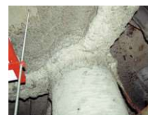
吹付けアスベスト (鉄骨材の耐火被覆)

建築基準法において規制対象とする吹付石綿等が施工されているおそれのある建築物に対しては、地方公共団体が調査および除去等の費用の一部を補助している場合があるので、お近くの地方公共団体にご相談ください。