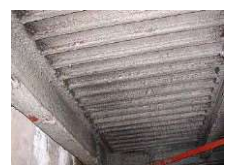
アスベスト含有吹付け ロックウール (鉄骨材の耐火被覆)